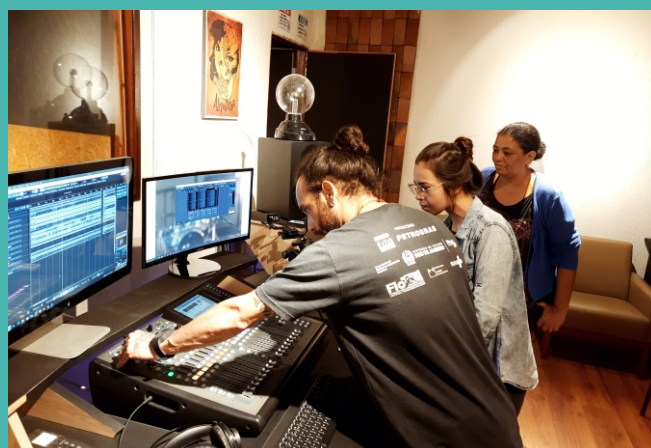
Aula de técnica de som