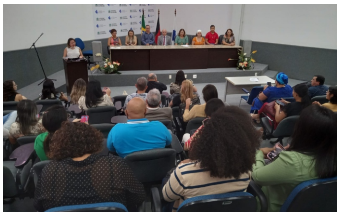
Solenidade de posse do CEDCA-PB

No dia 08 de maio, a Casa Pequeno Davi assumiu a presidência do Conselho Estadual dos Direitos da Criança e do Adolescente (CEDCA/PB) para o biênio 2023-2025. A nova composição do colegiado ficou com a Casa